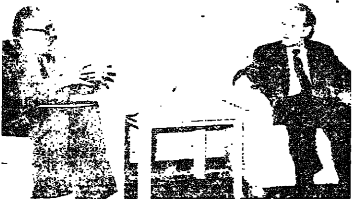
الاسد ووزير الدولة الكويتي الدكتور عبد الرحمن العوضي

ابغ الرئيس السوري حافظ الاسد مبعوثاً كويتياً أمس حرص سوريا على عدم التصعيد وعلى حل الخلافات العربية عن طريق الحوار. وكان الرئيس الاسد قد استقبل امس الدكتور عبد الرحمن العوضي وزير الدولة الكويتي لشؤون مجلس الوزراء، الذي سلمه رسالة خطية من الشيخ جابر الاحمد الصباح امير دولة الكويت، تتعلق بخلاف بين العراق والكويت. وقالت الوكالة العربية السورية للانباء، ان الرئيس الاسد أكد للمبعوث الكويتي ان حل الخلافات العربية بالحوار من شأنه ان يحقق حلاً ناجحاً ويساعد على تحقيق التضامن العربي والعمل العربي المشترك، الذي تحتاجه الامة العربية، والذي يعتبر ضرورة ملحة.